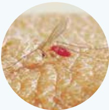
Door de beet van een zandvlieg kan uw hond besmet raken met de Leishmania-parasiet.

De beste manier om de kans op tekenziekten te verminderen, is om uw hond langwerkend tegen teken te beschermen met een tekenmiddel. Er zijn ook middelen verkrijgbaar, die uw hond zowel tegen teken als vlooiën beschermen. Houd er wel rekening mee dat er geen enkel tekenmiddel voor honden bestaat dat uw hond altijd 100% beschermt tegen teken. Daarom is het belangrijk om uw hond ook dagelijks te controleren op teken. Als er dan toch nog teken aangehecht zijn, is het belangrijk deze zo snel mogelijk te verwijderen. Uw dierenarts vertelt u graag meer.