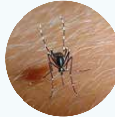
De hartwormmug komt op veel plekken in de wereld voor. Als de hartwormmug u of uw hond steekt, kan dit hevige jeuk veroorzaken.